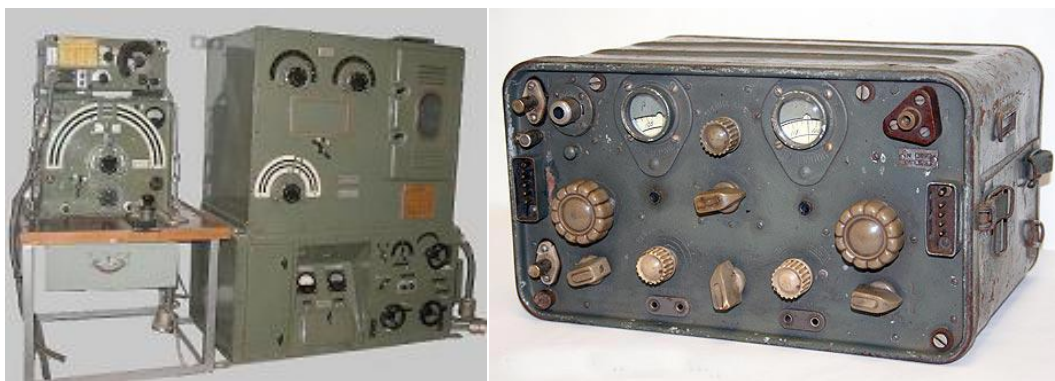
Radiostacje będące na wyposażeniu pułku - z lewej RAF, z prawej RBM