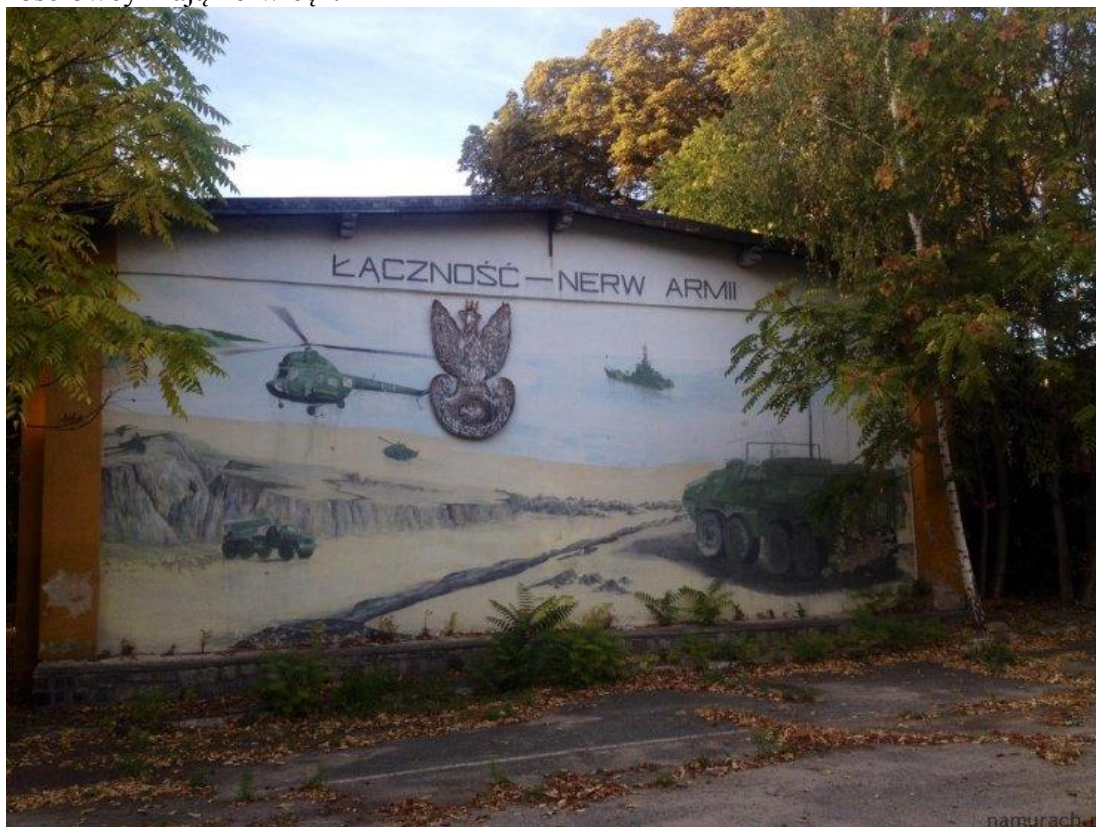
Fotografia nr 1.

A tekst o tej wymienionej nerwicy? Wszyscy go znają, a z pewnością większość osób trzymających niniejszy egzemplarz Komunikatu w ręku. Brzmi on tak: „Łączność jest nerwem armii” 2 , który powtarzany bez końca stanowi podstawę tej puenty: „... i dlatego łącznościowcy mają nerwicę”.