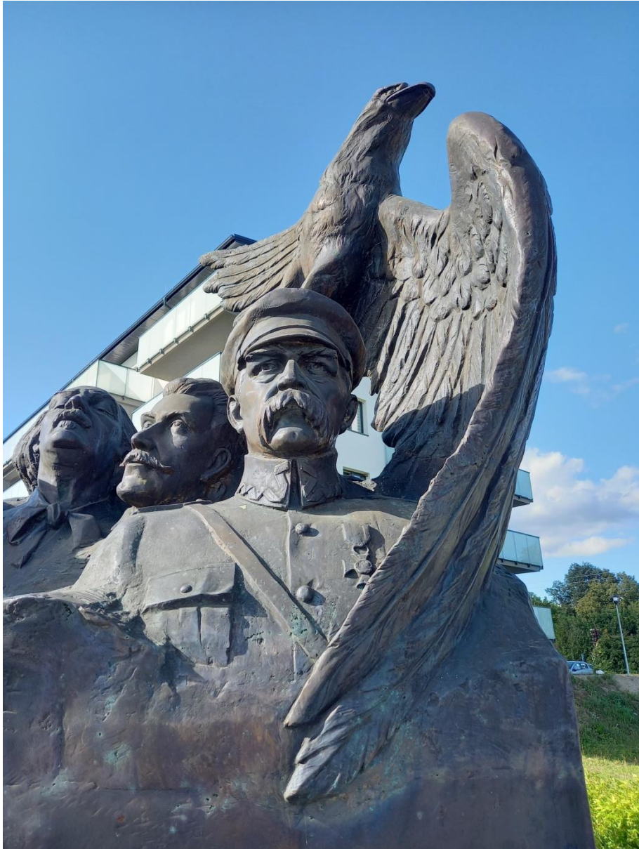
Fotografia nr 12.