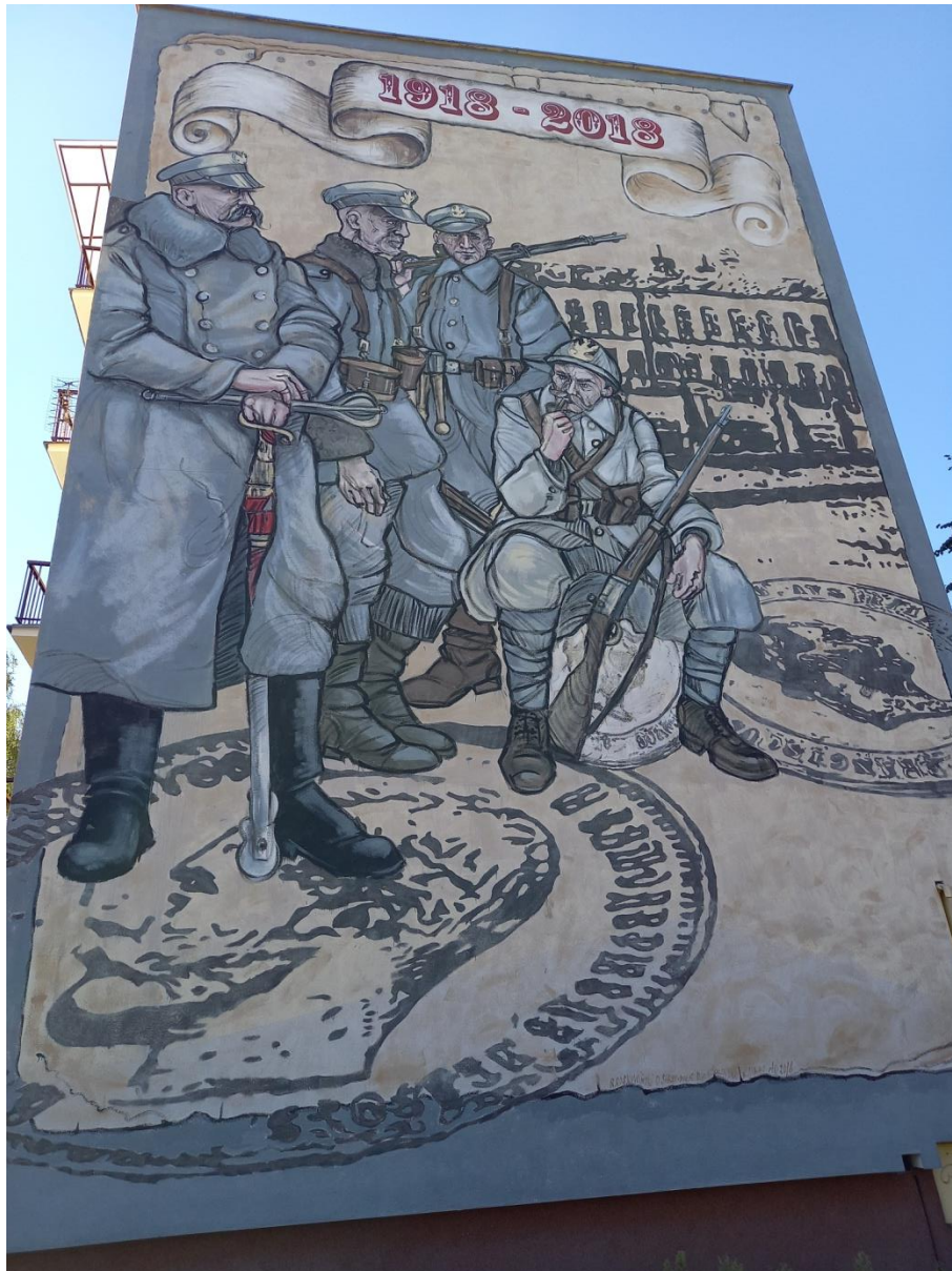
Fotografia nr 9.