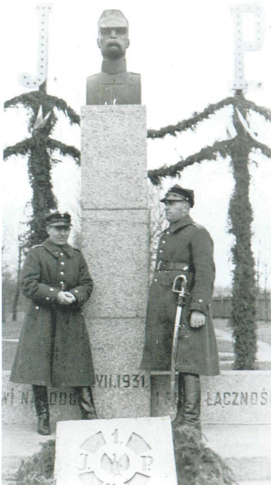
Fotografia nr 2.