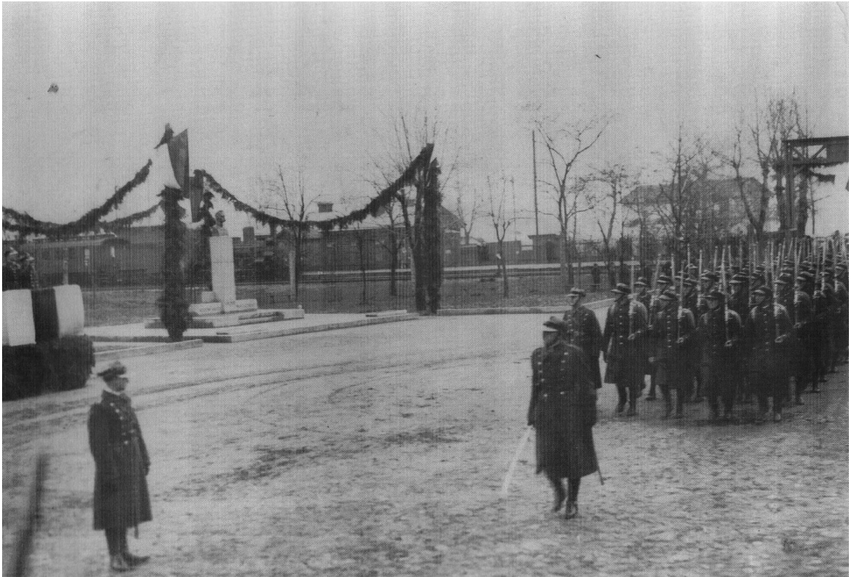
Fotografia nr 5.