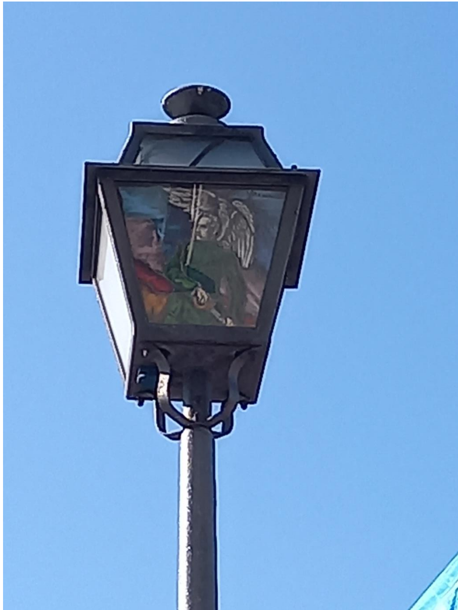
Fotografia nr 10.