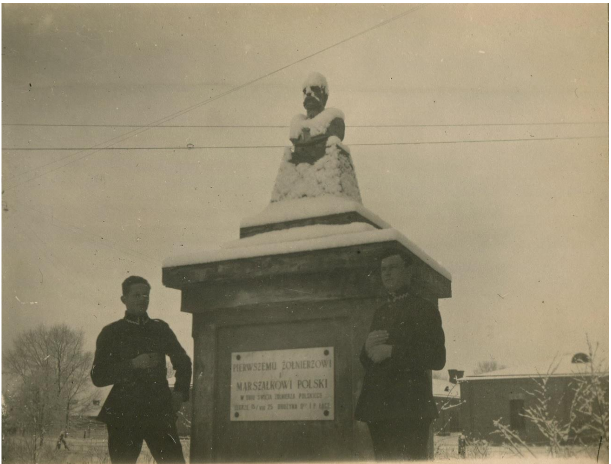
Fotografia nr 6.