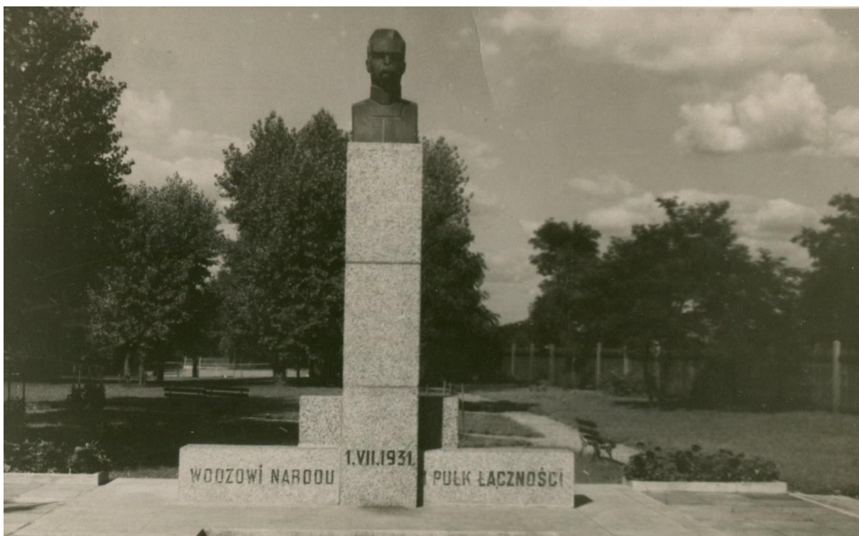
Fotografia nr 4.