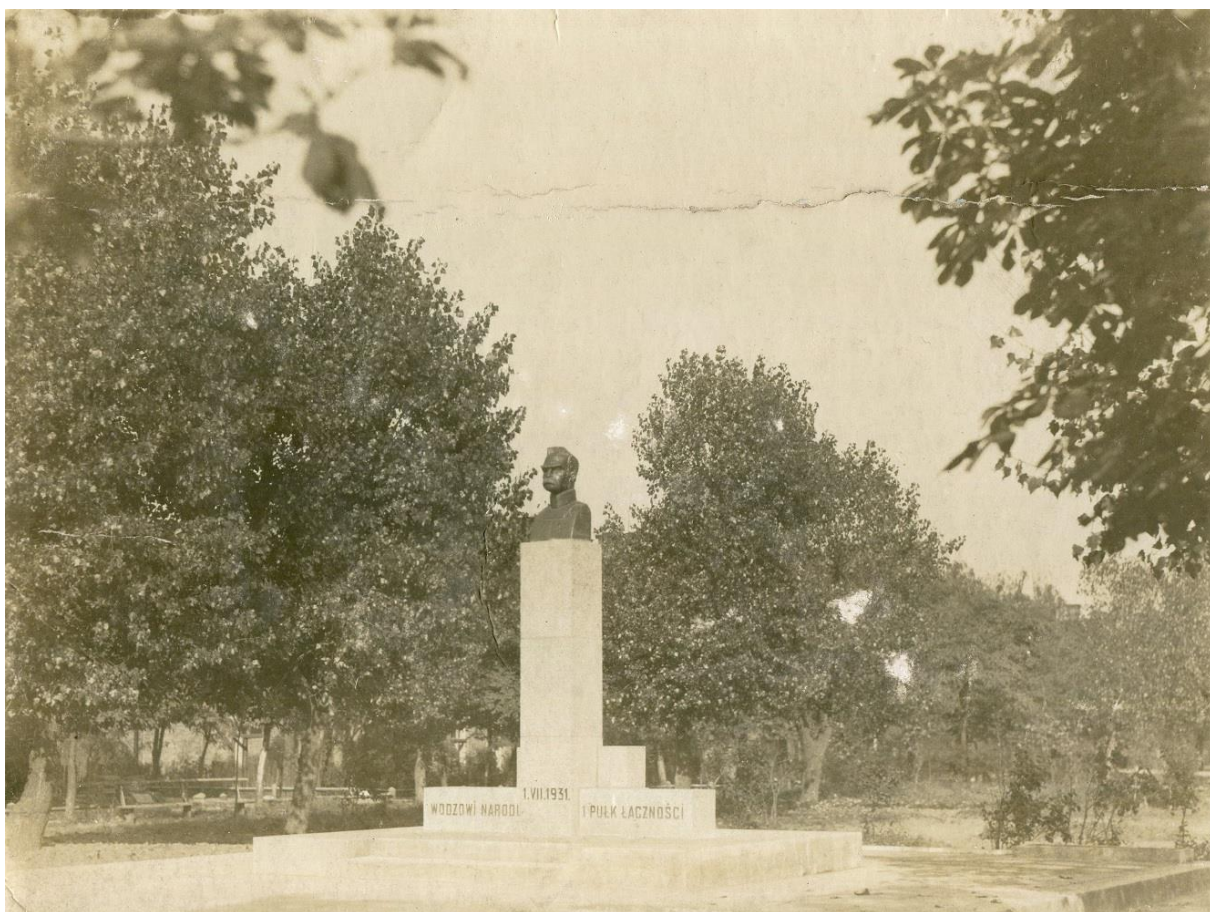
Fotografia nr 3.