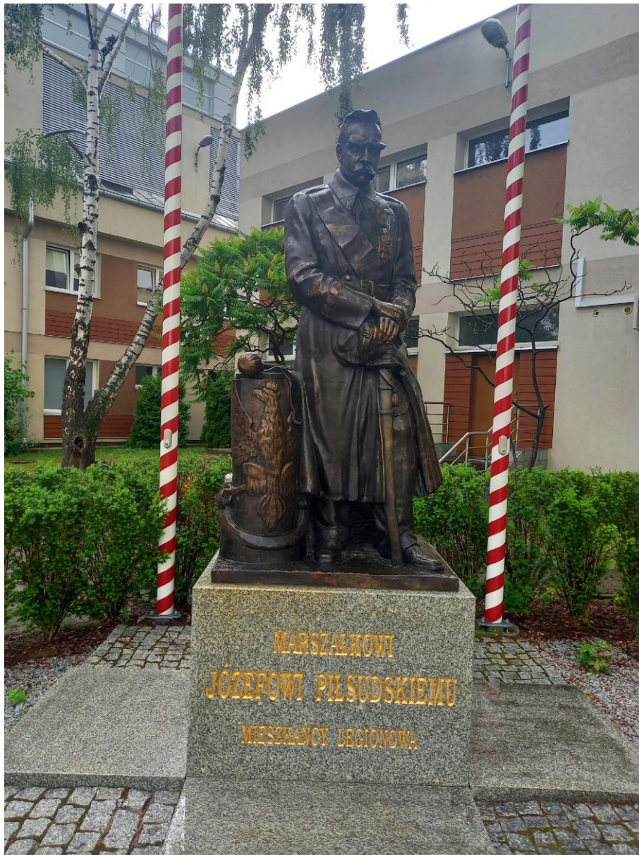
Fotografia nr 11.