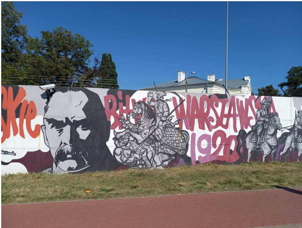
Fotografia nr 8.