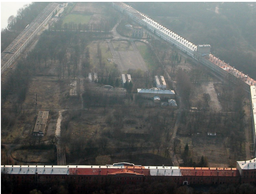
Twierdza Modlin z „lotu ptaka”