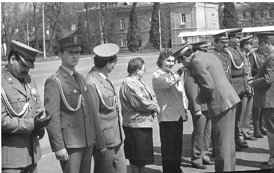
Święto Wojska Polskiego - Białystok 1991r.

Można śmiało powiedzieć, że w Białymstoku powstała osobowo nowa jednostka. Przez pewien czas scalanie i cementowanie kadry modlińskiej i białostockiej przybierało różne formy, te oficjalne ale i te z pogranicza westernu. Umiejętności fachowe potwierdzono w ramach ćwiczeń UW LATO 90. Pododdziały wykonały zadania wzorowo, były to już ostatnie ćwiczenia międzynarodowe w ramach „sypiącego” się paktu.