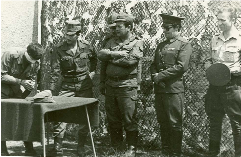
Zawody w ładowaniu magazynka /z zawiązanymi oczami/ na czas pod czujnym okiem sojuszników