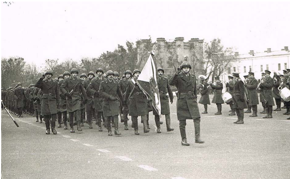
Kompania honorowa 25pł, dowodzi Andrzej Kopytko