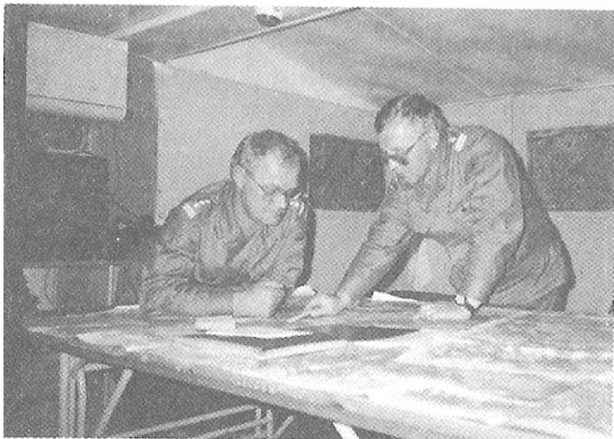
Ćwiczenie „Wrzesień '93”