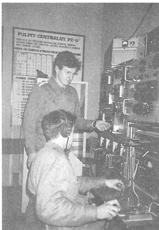
Sala szkoleniowa „radio” - Białystok 1991r.

Pułk stale się rozbudowywał, w krótkim czasie ukończono budowę kolejnych garaży, odremontowano bazę szkoleniową, w maju 1992 roku oddano do użytku dużą stację diagnostyczną dla wszystkich rodzajów pojazdów. Była to najnowocześniejsza stacja diagnostyczna w całym WOW. W następnym roku uruchomiono myjnię dla pojazdów samochodowych o zamkniętym obiegu wody. Te i inne przedsięwzięcia, fachowość kadry, wyniki kontroli, pozwoliły wynieść pułk do grona najlepszych w Wojsku Polskim.